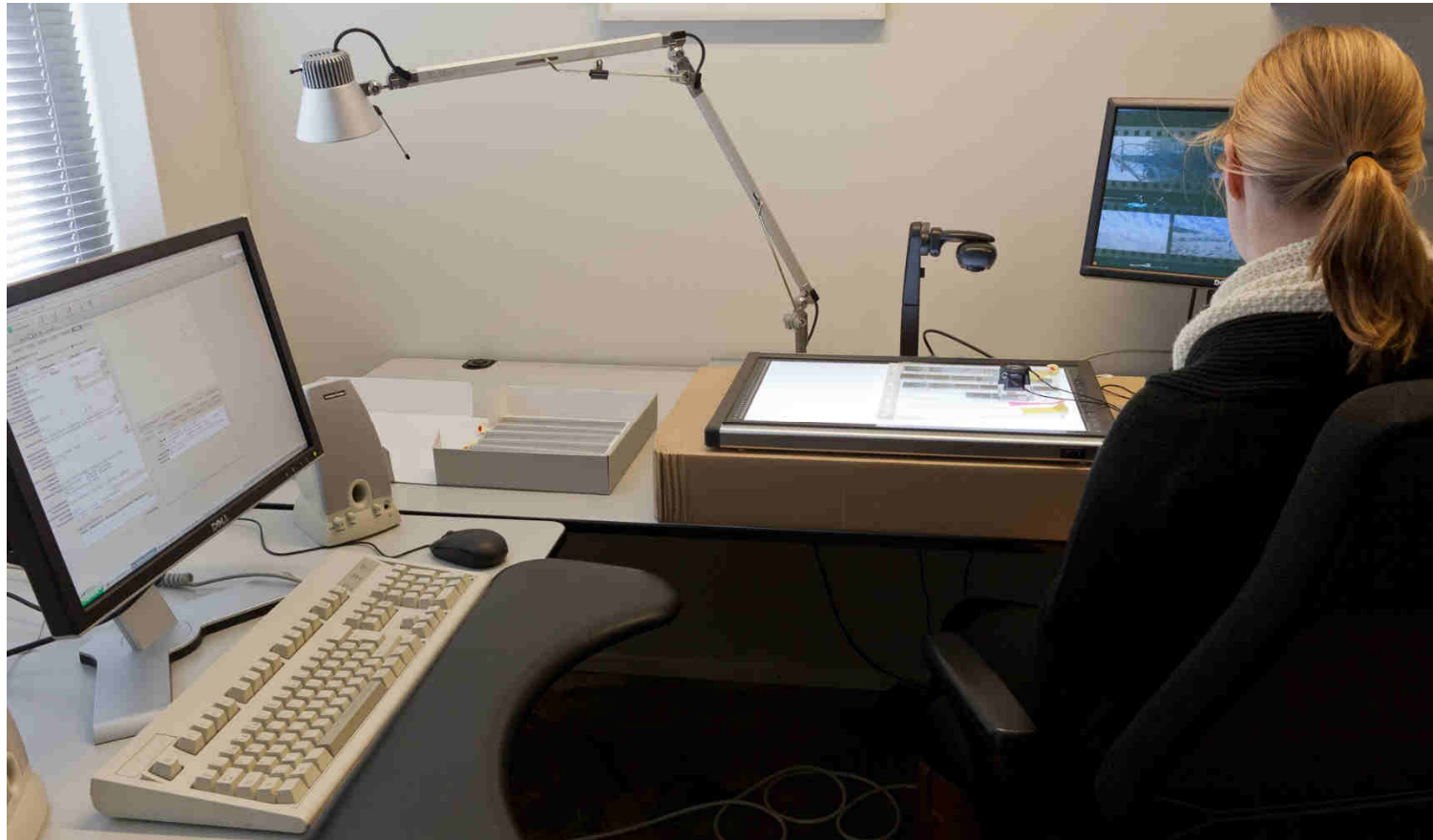
Luettelointia Suomen valokuvataiteen museossa.